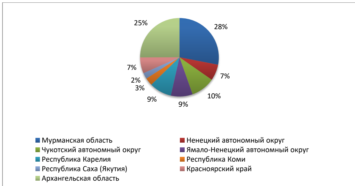
Рис. 2. Структура рабочих мест, создаваемых резидентам АЗРФ по регионам в 2023 г. (план., млрд руб.) 12 .

Структура распределения заявленных к созданию рабочих мест на 2023 г. также показывает, что более 50% планируемых к созданию рабочих мест приходится на европейскую часть АЗРФ.