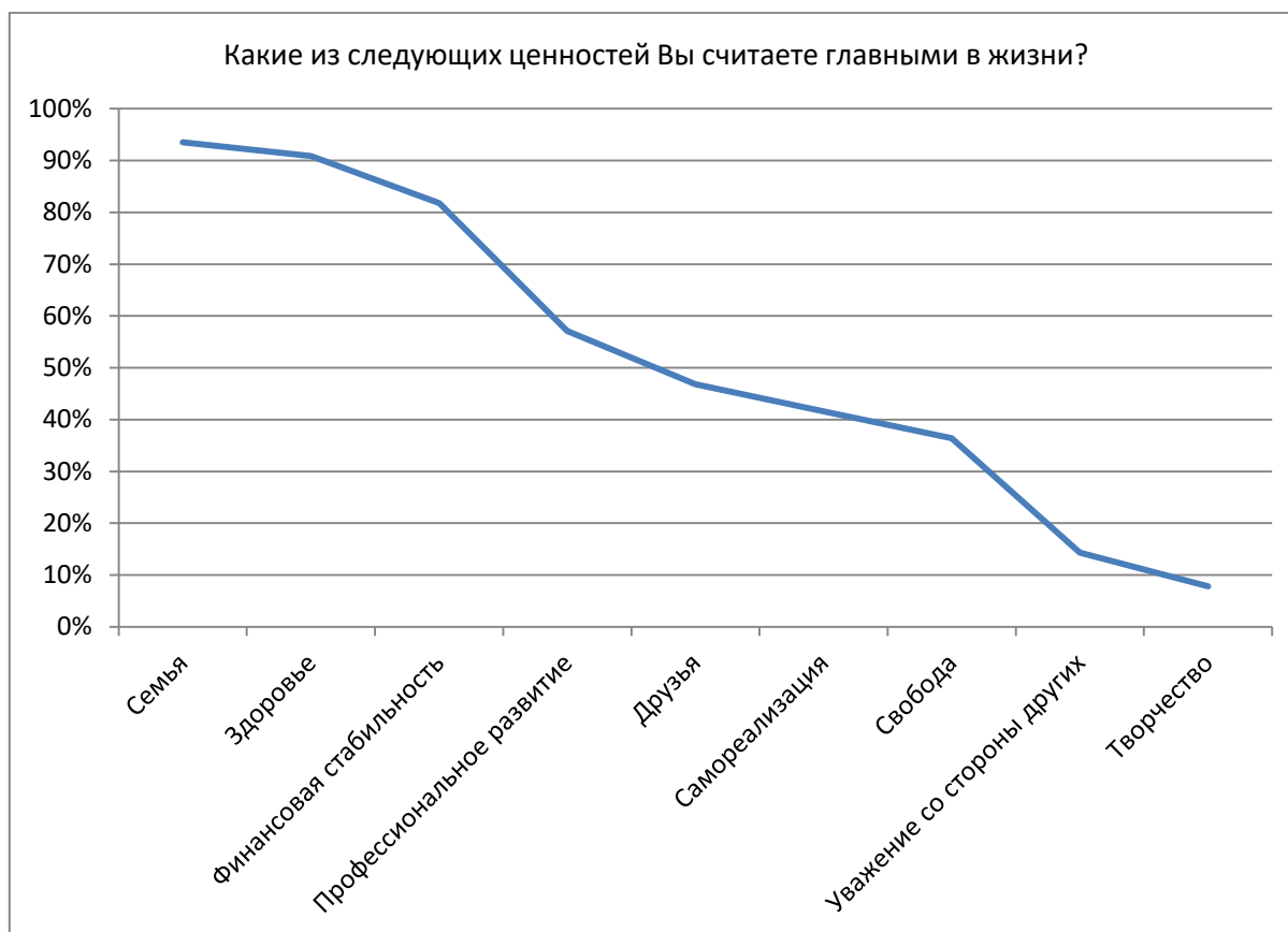
Рис. 2. Какие из следующих ценностей Вы считаете главными в жизни? 5

тели, что такие понятия, как «дружба», «доверие», «уважение», занимают значимое место в их жизни.