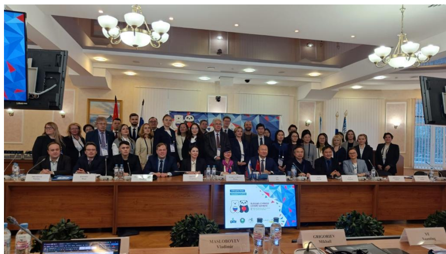
Рис. 1. Участники пленарной сессии, 11 декабря 2023 г., Северный (Арктический) федеральный университет имени М.В. Ломоносова.

Высокий экспертный уровень и масштаб площадки был обеспечен участием ведущих специалистов 10 китайских университетов, включая Пекинский технологический институт, Китайский океанический университет, Нанкайский университет, Даляньский морской университет, Центр полярных исследований Китая, Китайский нефтяной университет (Восточный Китай), Сямэньский университет, Сямэньский технологический университет, Харбинский инженерный университет, а также Китайскую академию наук и Генеральное консульство КНР в Санкт-Петербурге. С российской стороны в семинаре приняли участие представители Министерства иностранных дел РФ, Российского совета по международным делам, Ассоциации полярников России, ИМЭМО РАН, ФИЦ КНЦ РАН, ФГУП «Государственный трест «Арктикуголь» Министерства Российской Федерации по развитию Дальнего Востока и Арктики, Санкт-Петербургского государственного университета, Северо-Восточного федерального университета, Южно-Уральского государственного университета, Государственного университета морского и речного флота имени адмирала С.О. Макарова, Югорского государственного университета, Томского государственного университета, Московского автодорожного института, Мурманского Арктического университета, Сыктывкарского государственного университета, Северного (Арктического) федерального университета имени М.В. Ломоносова, Ассоциации поставщиков нефтегазовой промышленности «Созвездие» и др.