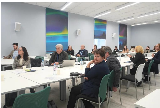
Рис. 3. Участники секции «Научная дипломатия в контексте транспорта и логистики», 12 декабря 2023 г., Архангельск.

На секции «Научная дипломатия в контексте транспорта и логистики» речь шла о важнейшей теме: развитии Северного морского пути. Эксперты поделились новейшими данными и аналитическими заключениями по поводу будущего морской логистики и транспортных сообщений в Арктике. По итогам работы данной секции в резолюцию будут включены умозаключения участников семинара, позволяющие выработать конкретные шаги в сторону дальнейшего развития кооперации между Россией и Китаем в этой области.