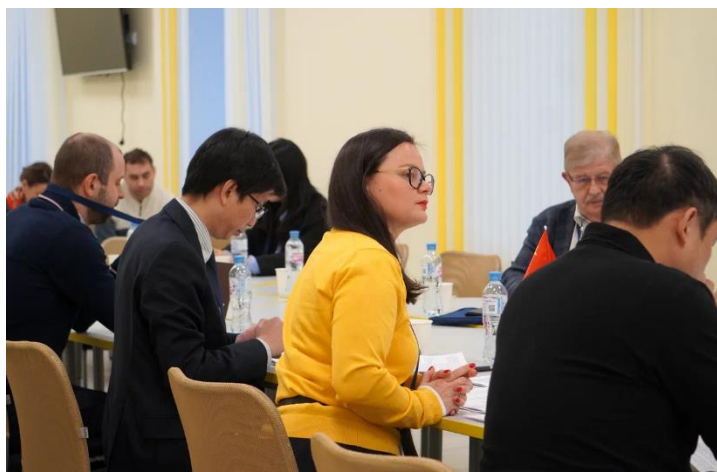
Рис. 4. Участники секции «Научная дипломатия в контексте экологических и климатических рисков», 12 декабря 2023 г., Архангельск.

Сквозной темой семинара стало обсуждение вопросов, связанных с языком научной коммуникации и подготовкой совместных научных публикаций международного формата, организованное в рамках международной школы «Коммуникация в глобальном контексте». Две сессии объединили спикеров, обладающих опытом публикации научных работ. В центре внимания была письменная научная коммуникация как инструмент передачи идей в научном и профессиональном сообществе.