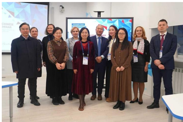
Рис. 2. Участники секции «Научная дипломатия в контексте геополитических вызовов», 12 декабря 2023 г., Архангельск.

На секции «Научная дипломатия в контексте транспорта и логистики» речь шла о важнейшей теме: развитии Северного морского пути. Эксперты поделились новейшими данными и аналитическими заключениями по поводу будущего морской логистики и транспортных сообщений в Арктике. По итогам работы данной секции в резолюцию будут включены умозаключения участников семинара, позволяющие выработать конкретные шаги в сторону дальнейшего развития кооперации между Россией и Китаем в этой области.