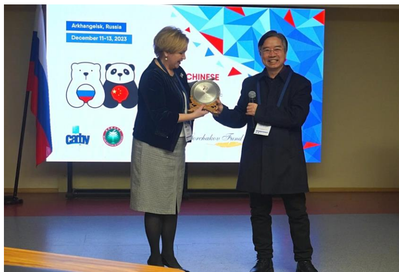
Рис. 6. Заключительная сессия, 13 декабря 2023 г., Архангельск.

Российско-китайский экспертный семинар «Развитие научной дипломатии в Арктике в условиях глобальных вызовов» стал значимым событием, которое участники признали как мероприятие, значимое для развития российско-китайского научного сотрудничества и поиска решений глобальных проблем Арктики.