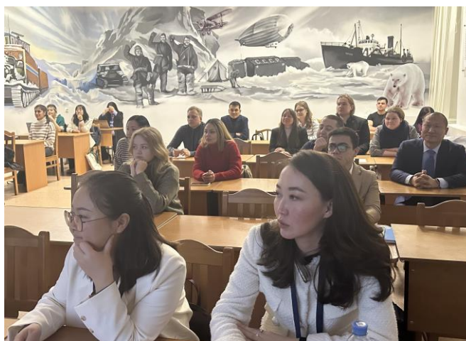
Рис. 4. Участники международной школы «Коммуникация в глобальном контексте», 12 декабря 2023 г., Архангельск.

Сквозной темой семинара стало обсуждение вопросов, связанных с языком научной коммуникации и подготовкой совместных научных публикаций международного формата, организованное в рамках международной школы «Коммуникация в глобальном контексте». Две сессии объединили спикеров, обладающих опытом публикации научных работ. В центре внимания была письменная научная коммуникация как инструмент передачи идей в научном и профессиональном сообществе.