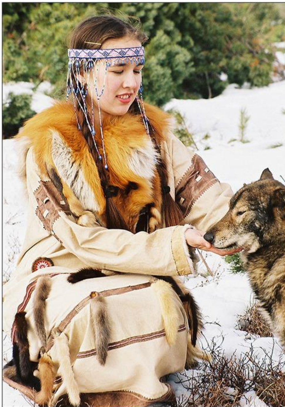
Рис. 3. Традиционный женский костюм. URL: http://forum.dpni.org/showthread.php?t=26850

уровня, деградация социальной сферы, рост заболеваемости и смертности — общие проблемы для всех коренных малочисленных народов округа [5].