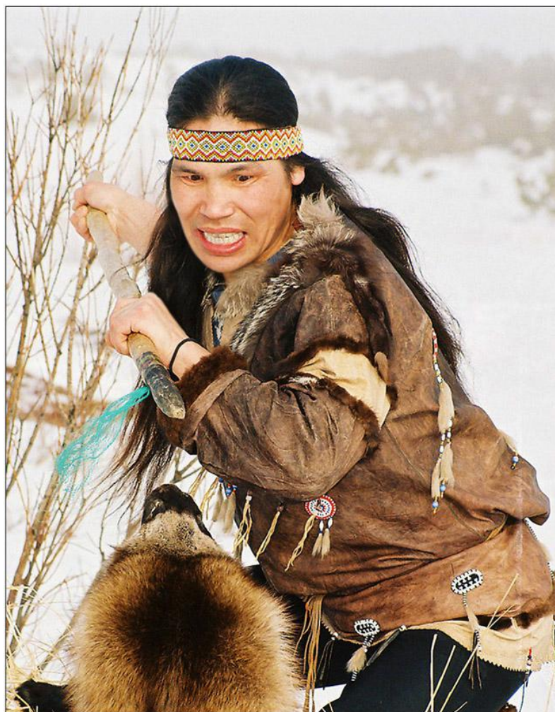
Рис. 2. Традиционный мужской костюм. URL: http://club.foto.ru/gallery/13/photos/774060/?&top100=1&sort=awards&next_photo_id=774232

началом всего года, но после переселения на полуостров и упрощения быта началом года стали считать май, как месяц, когда можно открывать промыслы [1].