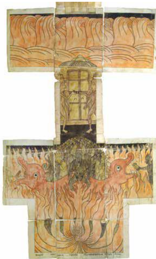
Рис. 14. Геенна огненная.

На листах 31–39 об. написан рассказ уже от лица инока Григория: «Святые входят в радость Господа». Все чины святых изображены группами на длинной ленте. В тексте перечисление чинов святых и на ленточной миниатюре начинается с Богородицы, заканчивается непорочными жёнами. В перечислении указаны семьдесят учеников, двенадцать апостолов, праведники Авраам, Исаак и Иаков, пророки, милостивые и нищелюбцы. Лица праведников были «красна, бела и румяна», их одежды белые или расцвечены весёлыми, яркими цветами — зелёными, жёлтыми и красными. Группы праведников на рисунке сопровождаются надписями (рис. 15–18).