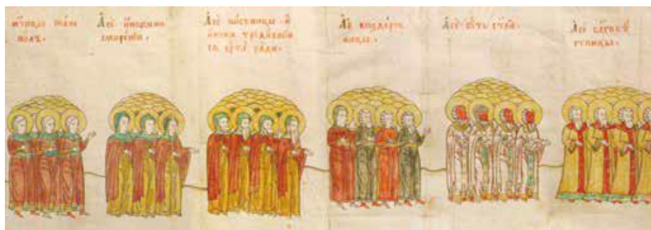
Рис. 16. Фрагмент рис. 15.