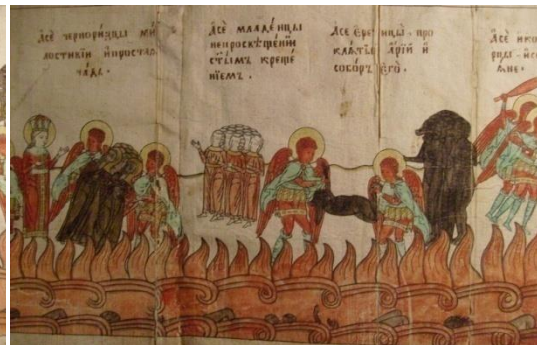
Рис. 21. Фрагмент рис. 19.

На двух последних листах 54–55 представлен короткий назидательный рассказ о трапезе благочестивых и нечестивых: «Поучение святого отца нашего Нифонта, как подобает православным христианам на трапезе есть с молчанием», которое читается на службе в субботу четвертой недели великого поста. Эта глава тоже проиллюстрирована. На одном листе изображён обед, во время которого за столом сидят скромные нищие, они удостоены присутствия самих ангелов и поэтому в молчании и смирении принимают трапезу. На другом листе изображены сидящие за трапезой богатые, за обедом у них началось празднословие, злые речи, недовольство пищей, они буйно ведут себя, поэтому ангел ушёл от них, а вместо ангела пришли тёмные бесы и стали сеять зло среди обедающих и лить на них «дым злосмрадный» (рис. 22). Рассказ о трапезе, проиллюстрированный миниатюрой, часто встречается в северных старообрядческих сборниках.