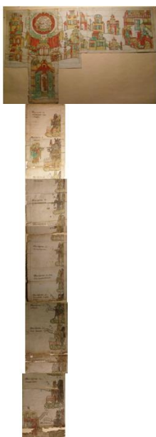
Рис. 7. Лестница мытарств.

Далее в тексте Феодора рассказывает иноку Григорию о хождении своей души по мытарствам, о борьбе ангелов за спасение её души. Мытарства Феодоры ярко описаны: они следуют друг за другом, снизу вверх, наподобие ступеней лестницы и расположены на облаках, где находятся один или несколько бесов с коробом со свёрнутыми свитками внутри. Душа послушницы помещена в руки двух ангелов, которые сопровождают её и пытаются защитить от злых бесов. Эти главы иллюстрируются рисунками к хождению преподобной Феодоры по воздушным мытарствам (рис. 7). Знакомясь с текстом, читатель мог зримо познакомиться с такими мытарствами, как оклеветание, поругание, зависть, ложь, гнев, гордыня, празднословие и сквернословие, лихва и лесть, пьянство, злопамятство, чревоугодие, блудное мытарство и др. Текст проиллюстрирован двумя складными миниатюрами. Двадцать одно мытарство проходит душа Феодоры, о чём подробно рассказано в книге и изображено на рисунках (рис. 8, 9).