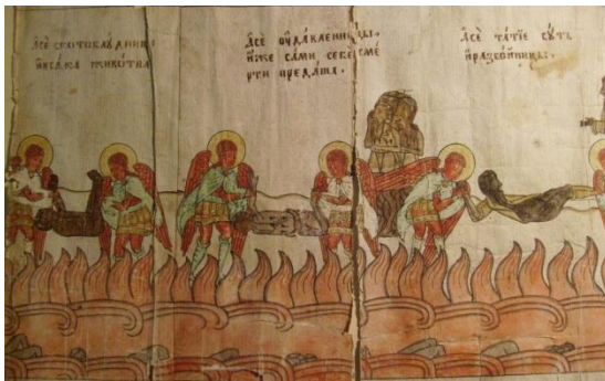
Рис. 20. Фрагмент рис. 19.