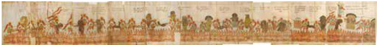
Рис. 19. Огненное море.