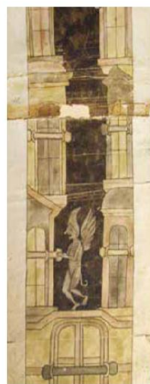
Рис. 12. Фрагмент рис. 13.