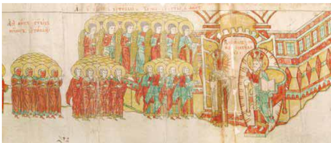
Рис. 18. Фрагмент рис. 15.

Красоте праведников противопоставляется безобразность грешников: грабителей, разбойников, прелюбодеев, гневливых, ярых, злопамятных, отступников, самоубийц. И как пишет автор в книге: «Было их множество по всей земле, «яко песок морской от Адама». Об этом написано в книге на листах 41–52. Текст также проиллюстрирован ленточной складной миниатюрой с изображением групп грешников, которых хватают и ввергают в огненную реку юноши-ангелы (рис. 19–21).