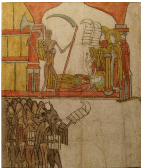
Рис. 6. Отхождение души от тела Феодоры.

Далее в тексте Феодора рассказывает иноку Григорию о хождении своей души по мытарствам, о борьбе ангелов за спасение её души. Мытарства Феодоры ярко описаны: они следуют друг за другом, снизу вверх, наподобие ступеней лестницы и расположены на облаках, где находятся один или несколько бесов с коробом со свёрнутыми свитками внутри. Душа послушницы помещена в руки двух ангелов, которые сопровождают её и пытаются защитить от злых бесов. Эти главы иллюстрируются рисунками к хождению преподобной Феодоры по воздушным мытарствам (рис. 7). Знакомясь с текстом, читатель мог зримо познакомиться с такими мытарствами, как оклеветание, поругание, зависть, ложь, гнев, гордыня, празднословие и сквернословие, лихва и лесть, пьянство, злопамятство, чревоугодие, блудное мытарство и др. Текст проиллюстрирован двумя складными миниатюрами. Двадцать одно мытарство проходит душа Феодоры, о чём подробно рассказано в книге и изображено на рисунках (рис. 8, 9).