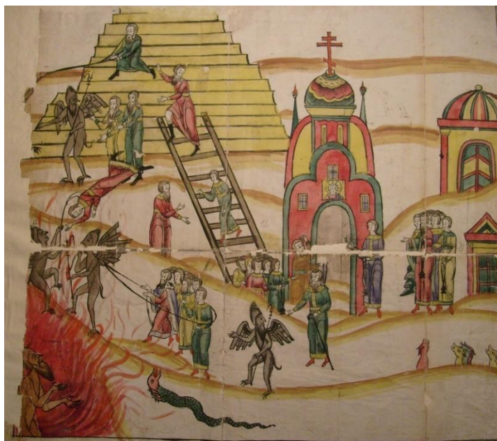
Рис. 2. Нижняя часть ключа (бородка).

Средняя часть ключа (стержень) представляет собой лестницу из 60 пронумерованных ступеней. Образ лестницы, или лестницы, восходит к известному видению во сне Иакова из книги Бытия, 28 глава. Образ лестницы (лествицы) является главным в произведении Иоанна Синайского «Лествица», которая писалась как руководство к иноческой жизни. «Лествица» была популярной и любимой книгой на Руси, сюжеты из неё черпались русскими писателями и поэтами, некоторые главы из «Лествицы» публиковались в дореволюционных журналах для домашнего чтения, для педагогического воспитания [3, Ненашева Л.В., с. 159]. Как отмечает Р.В. Багдасаров, «на Руси Лествица Иоанна Синаита приобрела особую популярность во время аскетического подъёма XIV–XV веков» [4, Багдасаров Р.В., с. 7]. В самой «Лествице» перед началом основного текста и в других ранних древнерусских рукописях изображали лестницу из тридцати ступеней по числу лет жизни Иисуса Христа до крещения, «затем все более распространяется изображение взбирающихся по ступеням монахов и мешающих им бесов». И число ступеней увеличивается до шестидесяти [4, Багдасаров Р.В., с. 7].