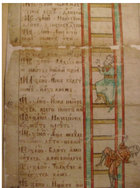
Рис. 3. Лестница 60 заповедей.