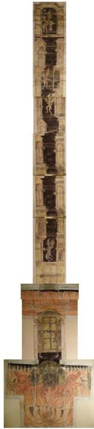
Рис. 13. Падение в геенну огненную.