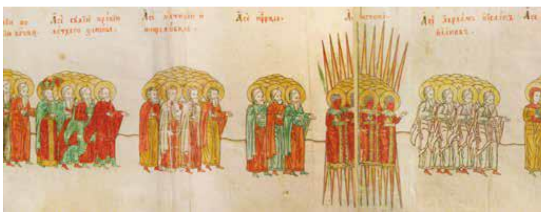
Рис. 17. Фрагмент рис. 15.