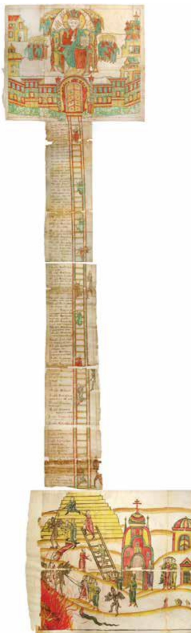
Рис. 1. Ключ к вратам от царства небесного (лестница 60 заповедей).

Общий вид композиции представляет собой подклеенные встык листы, образующие форму ключа, который состоит из бородки, стержня и головки. На бородке ключа изображены изножие лестницы, по которой люди, избравшие путь духовного восхождения, пытаются подняться, но не всем это удаётся сделать. У кого-то это получается, и вот уже человек, стоящий на верхних ступенях приставленной лестницы, пытается перейти на лестницу шестидесяти заповедей. Крылатые бесы, традиционно изображаемые с торчащими шишками на голове, своими крюками пытаются стащить людей с духовной лестницы, и одному бесу это удаётся: он стаскивает молодого человека и увлекает его в огненную пучину. Здесь же, в левой стороне миниатюры, группа людей запрягла беса как символа греховной жизни, который тянет их за собой, увлекая в огонь страстей. В нижней центральной части листа бес жестом приглашает следовать за собой сомневающегося в своём выборе человека (рис. 2).