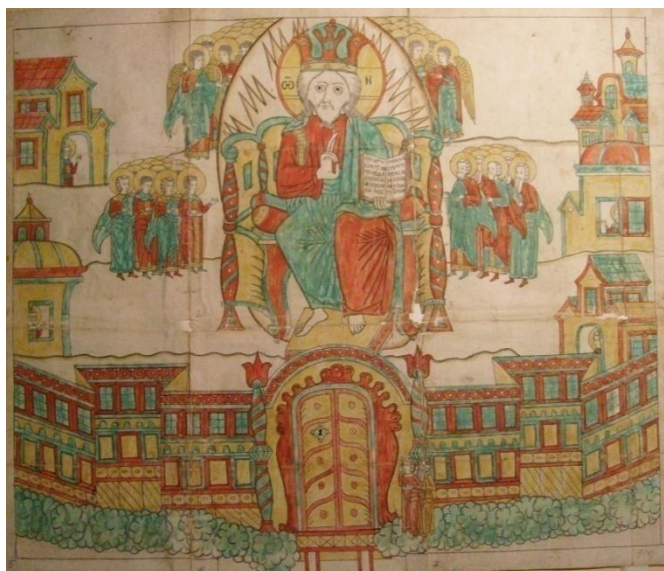
Рис. 5. Царство небесное (головка ключа).

На рукописных листах 7–29 об. представлен текст из жития Василия Нового о мытарствах блаженной Феодоры. Текст повествует о том, как святая Феодора по смерти проходила 21 воздушное мытарство и возвестила об этом в сонном видении ученику преподобного Василия Нового — Григорию. Феодора была послушницей у инока Григория. После её кончины он очень пёкся о своей послушнице, много молился о её душе, и во сне ему удалось увидеть загробную жизнь Феодоры. Рассказ инока Григория о хождении по мытарствам блаженной Феодоры включён в Житие Василия Нового, который проживал в Византии в X веке, перевод Жития на славянский язык был сделан на Руси в конце XI в. Со второй половины XVII в. лицевые списки видений инока Григория и хождения преподобной Феодоры широко распространяются в старообрядческой среде, а с XVIII в. эти сюжеты часто встречаются в старообрядческих лубках и рисованных листах, особенно на Русском Севере [5, Православная энциклопедия, с. 210–212].