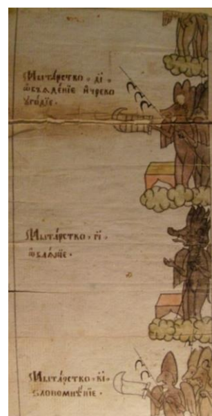
Рис. 9. Мытарства 12–14.