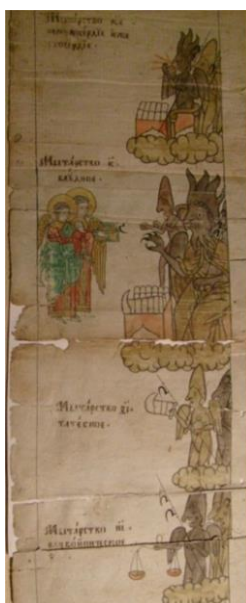
Рис. 8. Мытарства 18–21