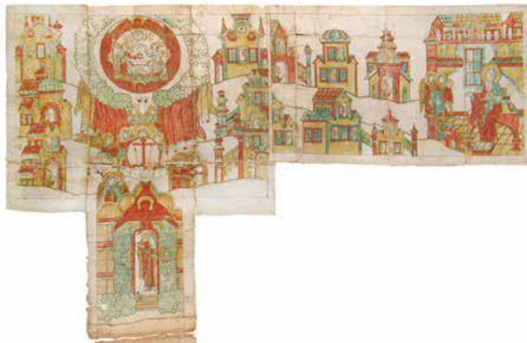
Рис. 10. Небесная обитель.

Мытарства блаженной Феодоры благополучно заканчиваются: ангелам удаётся спасти её душу от бесов, которые так и не смогли найти тяжких грехов, совершённых при жизни послушницей Феодорой. Далее Феодора рассказывает: «Мы же радостные отошли от бесов, приблизились к вратам небесным и вошли в них». Затем она подробно описывает небесное царство и свою радость, оказавшись в небесной обители. На миниатюре изображены обители, характерные для северных рисунков. Везде из окошек выглядывают святые. Ангелы подносят душу Феодоры, и все святые радуются её спасению, а ангелы ей говорят: «Видишь, Феодора, от каких мук избавил тебя Господь молитвами святого Василия». В правой части изображён преподобный Василий, сидящий на престоле. Он встречает душу Феодоры через сорок дней после её разлучения с телом (рис. 10).