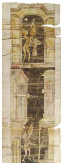
Рис. 11. Фрагмент рис. 13.

Ещё на одной складной миниатюре представлены рисунки с изображением душ, задержанных на мытарствах (последовательность рисунков сверху вниз), переходящих в изображение входа в геенну огненную и престола сатаны (рис. 11–14).