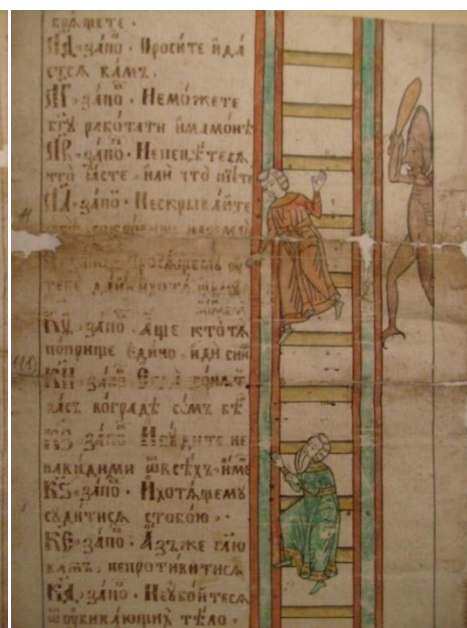
Рис. 4. Лестница 60 заповедей (стержень ключа).

В головку ключа художник поместил Царство Небесное; лестница заповедей доходит до самых царственных врат. Господь на престоле возвышается в центре небесного града. В левой руке он держит открытое Евангелие, персты правой руки сложены в двоеперстное знамение. За спиной Спаса изображено сияние в полусфере, за которой написаны ангельские фигуры с обеих сторон. По правую сторону от трона изображены фигуры с безбородыми ликами (молодые юноши и, возможно, женщины), по левую сторону — бородатые. В нижней части миниатюры представлены городские стены домов, составляющих единое целое, с окошками, расчерченными в клетку, с красивыми вратами и фигурными столбами по бокам — характерное изображение райского града в северных старообрядческих рукописях. У городских врат стоит юноша и старец. По краям картины нарисованы 5 домов, в четырёх из которых виднеются фигурки святых. «Символика и форма картинки прозрачны. Царство небесное открывается ключом божиих заповедей. <...> Ключ предназначен для двери, и можно не сомневаться, что составителям сюжета была хорошо известна эта «дверь» [4, Багдасаров Р.В., с. 10] (рис. 5).