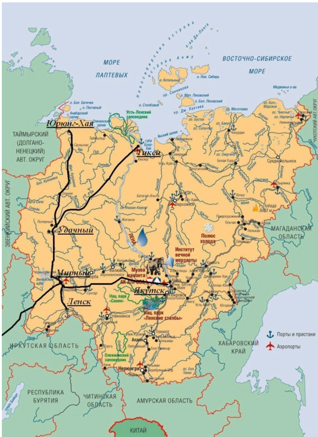
Рис. 2. Предлагаемая сеть «облегчённых» железных дорог

Имея в своем составе широкий спектр макро- и микроэлементов, высокие концентрации токсичных солей, субстраты отвалов негативно влияют на состояние природного поч-