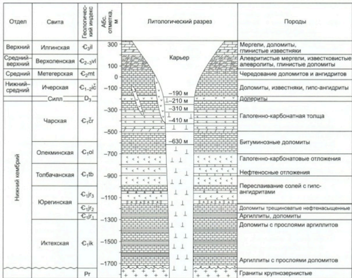
Рис. 4. Схематичный геологический разрез месторождения тр. Мир

комплексы для разборки отвалов, дробления негабаритов, а также специальные транспортные и погрузочные средства.