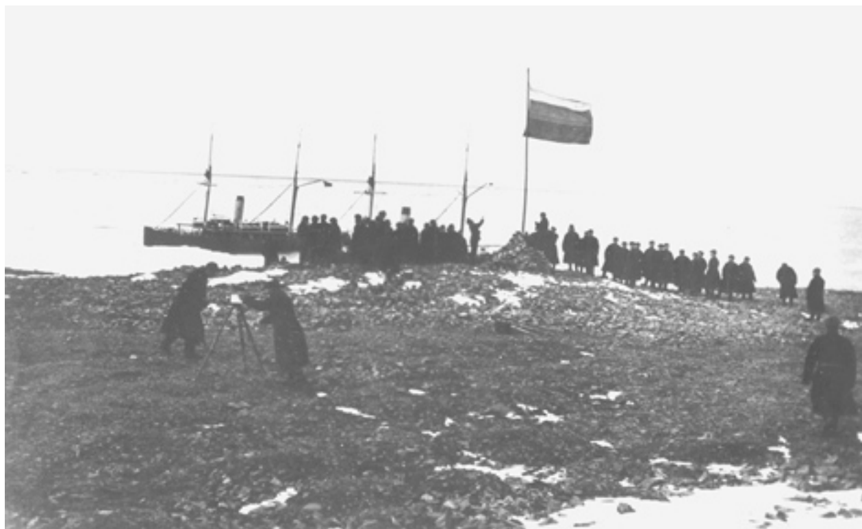
Рисунок 4. Подъём русского флага на Земле Николая II (Северной земле).

Российское правительство информировало правительства союзных и дружественных держав нотой от 20.09.1916 о включении этих земель в состав Российской империи и объявило, что считает также составляющими нераздельную часть империи острова Генриетта, Жанетта, Беннета, Геральда и Уединения, которые вместе с островами Новосибирскими, Врангеля и иными, расположенными близ азиатского побережья, составляют продолжение