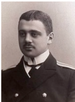
Рисунок 3. Капитан Б.А. Вилькицкий

рис Андреевич Вилькицкий (1885—1961). В ходе экспедиции было открыто несколько новых островов: Северная земля (Земля Николая II), Малый Таймыр, Старокадомского, Жохова.