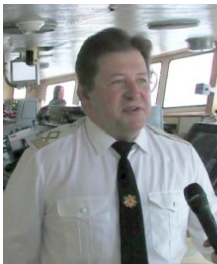
Рисунок 2. Капитан Александр Пышкин

качества которого обеспечивают безопасное плавание во всех морях и океанах. 18 января 2015 года после пяти месяцев кругосветки судно вернулось в Кронштадт. Экспедицией было установлено, что залив Кривошеина архипелага Новая Земля на самом деле является проливом, документально зафиксировано образование нового мыса, обрушение и отступление ледников в среднем на четыре-пять километров вглубь суши. Другими заслугами экипажа в деле корректировки географических карт стали подтверждение открытия острова Яя, расположенного в море Лаптевых, ранее не указанного на картах. В целом же экспедицией было обнаружено около двух десятков новых географических точек 3 .