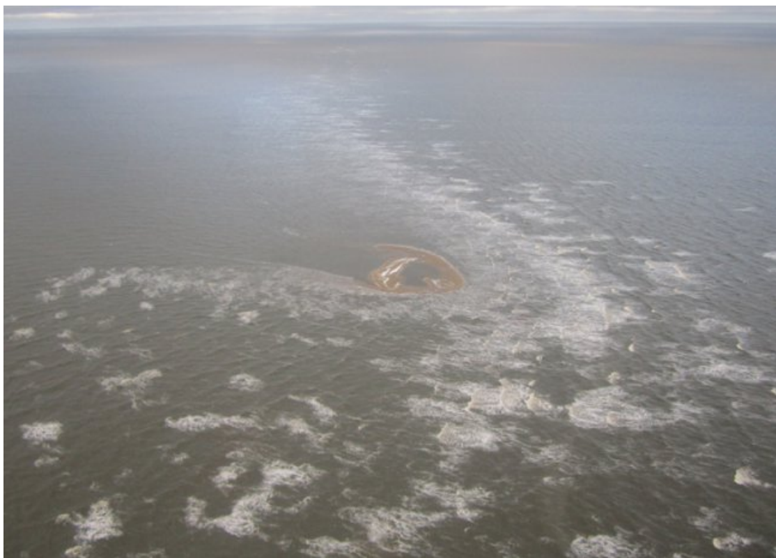
Рисунок 1. Остров Яя.

В XXI столетии в Арктике тают многовековые ледники, появляются не известные ранее острова и мысы. Россия начинает прирастать новыми островами в СЛО, что реально увеличивает территориальные воды России, её особую экономическую зону (ОЭЗ) 1 . Экипаж транспортного вертолётa Ми-26 в 2013 году возил грузы из арктического порта Тикси в Якутии на остров Котельный (Новосибирские острова), где создаётся арктическая военная база и возрождается аэродром «Темп». По пути лётчики заметили с воздуха небольшой клочок суши, который не был отмечен на картах. Как вспоминает помощник командира вертолета Ми-26 Виталий Михальчук, остров назвали Яя потому, что каждый начал кричать: «Это я, это я его нашёл!». Зимой острова было не видно. А потом он словно поднялся из глубины. Так вертолётный отряд увеличил площадь России, пусть на несколько сот квадратных метров» 2 .