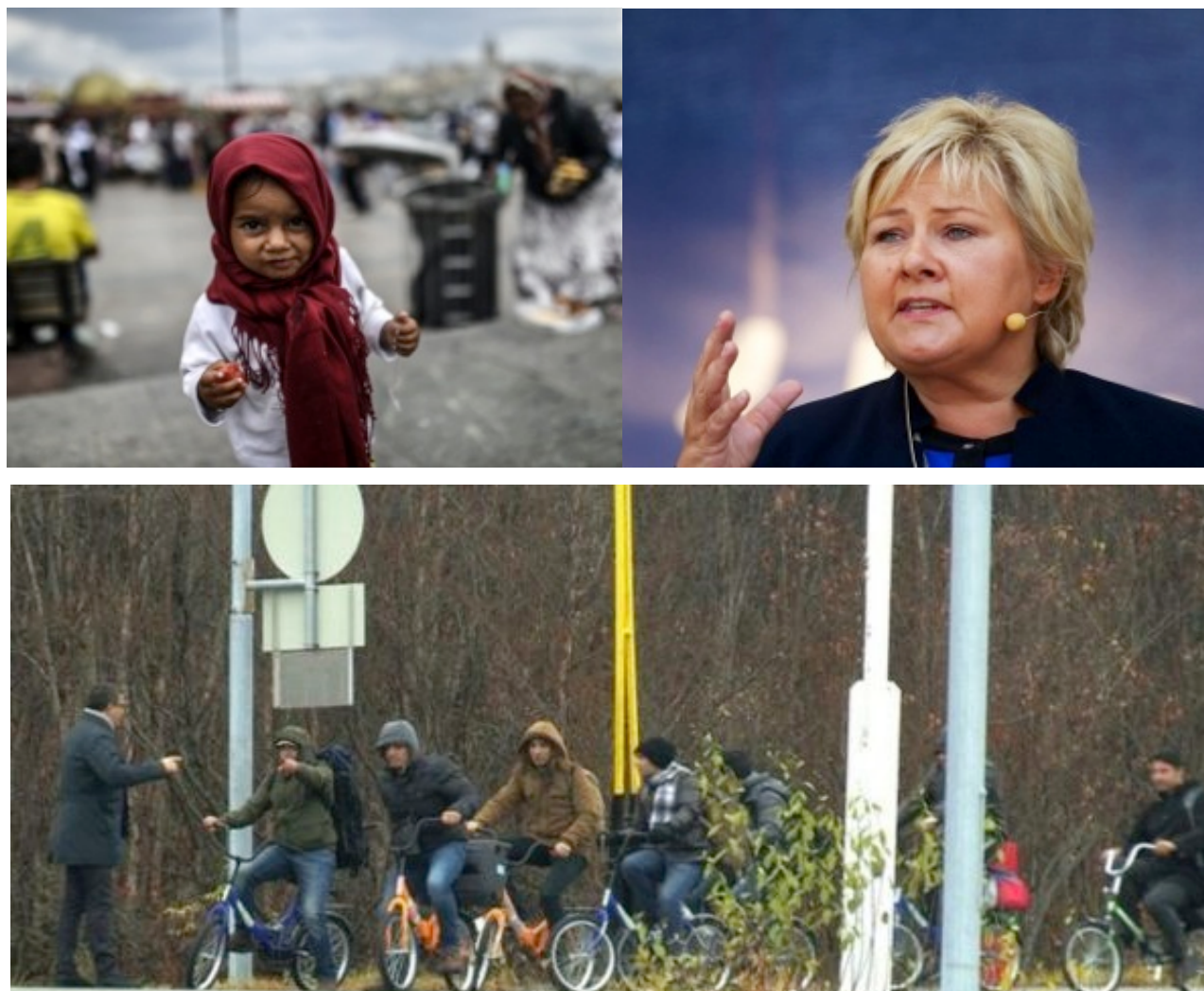
Рис.2. Норвегия принимает мигрантов 3 .

ностей норвежского общества, с его высоким уровнем толерантности и открытости для проникновения других культур. После событий 2011 года, а также прихода к власти представителя от консерваторов Эрны Сульберг ситуация несколько меняется. Тот факт что, на выборах 2013 года правоцентристы Норвегии образовали альянс с Партией Прогресса, не предвещал дальнейшей либерализации норвежской этнической политики. Однако на практике антимигрантская риторика Партии Прогресса немного поубавилась.