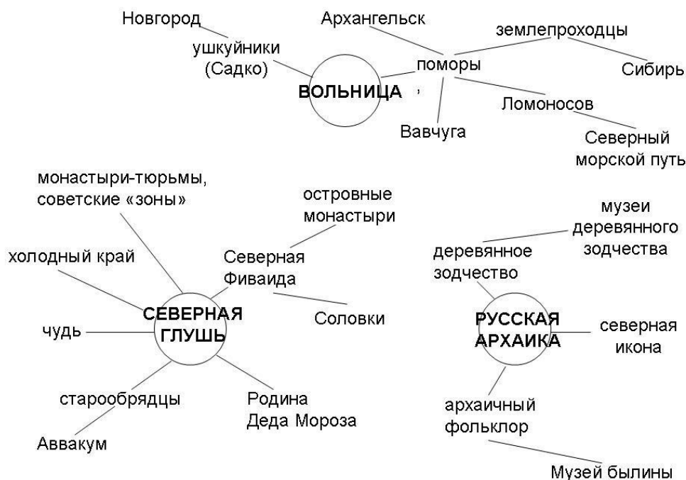
Рис. 2. Калуцков В.Н. Образно-географическая карта Русского Севера (2018).

шафтной концепции и культурной географии, опубликовал монографию «Ландшафт в культурной географии» (2008), ряд статей о Русском Севере: региональный культурный ландшафт и его циклы (2005), Культурно-ландшафтное районирование Русского Севера: Постановка проблемы (2007), Русский Север и его вековые геополитические тренды (2010), О геоконцепте Русского Севера (2011). Анализ гуманитарных исследований региона, выполненных крупными учёными, позволил В.Н. Калуцкову выявить наиболее типичные комплексные характеристики, к которым относятся: удалённость, окраинное положение Русского Севера, отсутствие крепостного права и помещичьих землевладений, суровые природные условия, севернорусский жилищный комплекс, слабая освоенность территории, комплексный тип крестьянского хозяйства, полиэтничность при ведущей роли севернорусской традиционной культуры, севернорусские диалекты, старообрядчество и народное православие. В основу авторской образной карты Русского Севера В.Н. Калуцкова положены три основных концепта: вольница , северная глушь , русская архаика [9, Калуцков В.Н.].