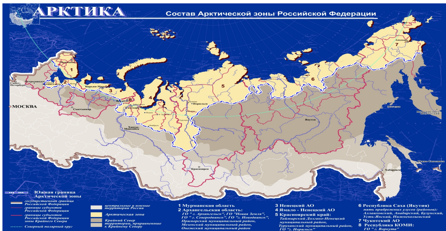
Рисунок 3. Состав АЗРФ в 2014 году