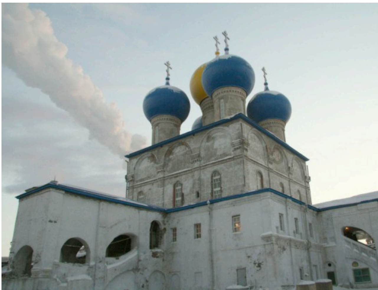
Рисунок 2. 600-летие Николо-Корельского монастыря в Северодвинске.

В среднегодовом исчислении численность трудовых ресурсов Северодвинска составила 120,1 тыс. человек, из них в экономике города занято 93 тыс. человек (49% общей численности постоянного населения). Преобладающая часть занятого населения сосредоточена в крупных организациях и субъектах среднего предпринимательства. Основными отраслями производства являются судостроение и судоремонт, электроэнергетика, производство строительных материалов, пищевая промышленность и др. Комплекс градообразующих предприятий Северодвинска составляют ОАО «ПО «Севмаш», ОАО «ЦС «Звездочка», ОАО «СПО «Арктика», на которых трудится 37 тысяч человек или 40% занятого в экономике населения города 3 . Основу экономики города составляет крупнейший и уникальный судостроительный комплекс страны, где производятся и ремонтируются корабли для Военно-морского флота России.